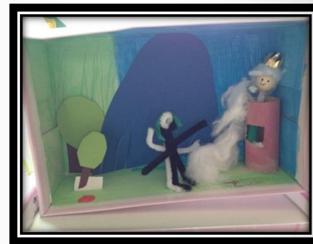
Märchen im Schuhkarton