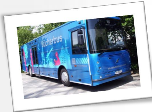
Bücherbus für die Klassen 1 und VSK